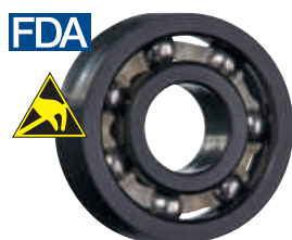
PE 保持器, 不銹鋼滾珠