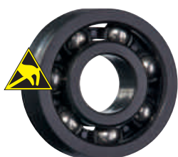
PA 保持器, 不銹鋼滾珠